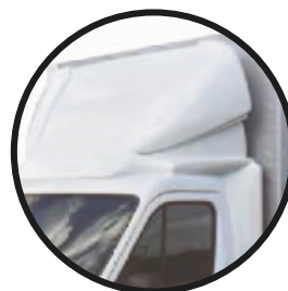
Dach- und Seitenspoiler