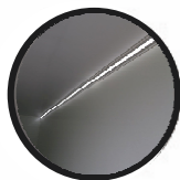
LED-Lichtband für optimale Innenbeleuchtung