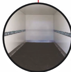
Multiplex-Plattenboden und Alu-Sockelscheuerleiste