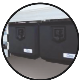
Staubboxen aus Kunststoff